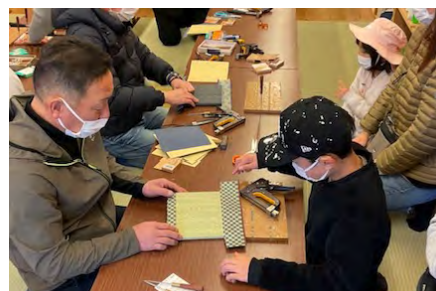
親子ミニ畳作成ワークショップ