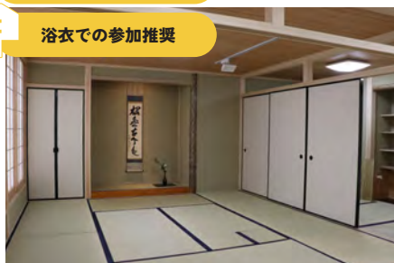
子どもお茶会体験