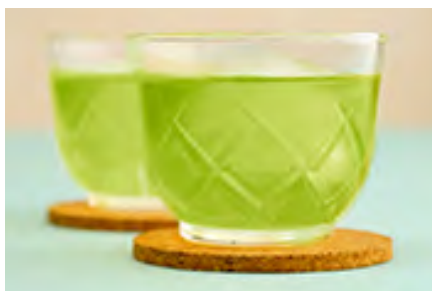
日本茶について学ぼう！日本茶クイズ