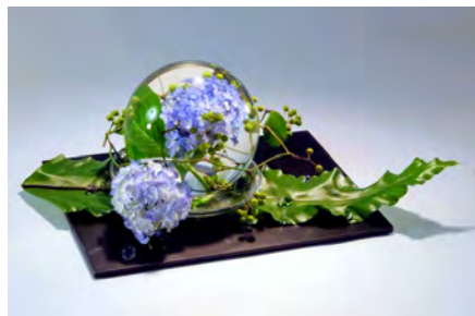
涼しげないけばな体験